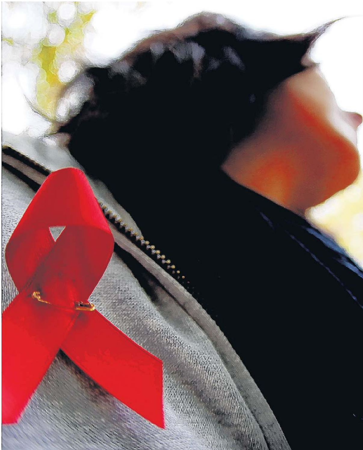
Die Rote Schleife ist weltweit das Symbol für die Solidarität mit HIV-positiven Menschen. Der Welt-Aids-Tag wird jährlich von der Aids-Organisation der Vereinten Nationen organisiert und findet am 1. Dezember statt.